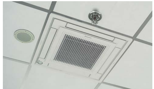
La cassette suspendue VISTA s'insère dans une ossature de plafond de 2 pi x 2 pi et peut être installée à proximité d'autres accessoires du bâtiment.

Capteur de présence et de plancher (pièce en option n° BRYQ60A2W ou BRYQ60A2S) – Les capteurs de présence et de plancher sont des capteurs infrarouges capables de détecter les mouvements dans la pièce. Lorsque vous êtes dans la pièce, le système fonctionne normalement. Si vous quittez la pièce pendant plus de 20 minutes, le système passe automatiquement en mode économie d'énergie. L'utilisation de l'Intelligent Eye permet une économie allant jusqu'à 20 % pour la climatisation et jusqu'à 30 % pour le chauffage. Le capteur de plancher détecte la température moyenne du plancher et assure une répartition uniforme de la température entre le plafond et le plancher.